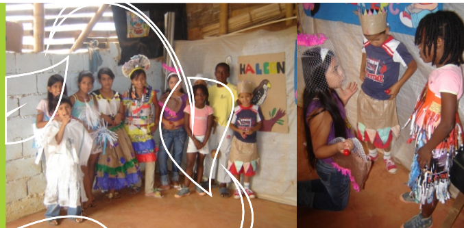
Fotografías de los niños participantes del Taller CANICA: Naturaleza escrita en el barrio Brisas de las Palmas, Santiago de Cali - Colombia, 2009.