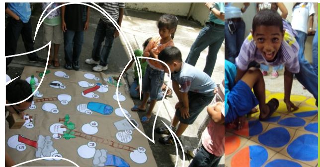
Fotografías de los niños participantes del Taller CANICA: Naturaleza escrita en el barrio Tierra Blanca, Santiago de Cali - Colombia, 2010.