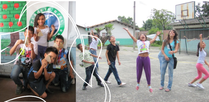
Fotografías de los niños participantes del Taller CANICA: Naturaleza escrita en el barrio Mariano Ramos, Santiago de Cali - Colombia, 2011.

Una intervención intensiva que finalizó con la edición de un libro recopilatorio de cuentos y clausura del taller en las instalaciones de la alcaldía de Cali.